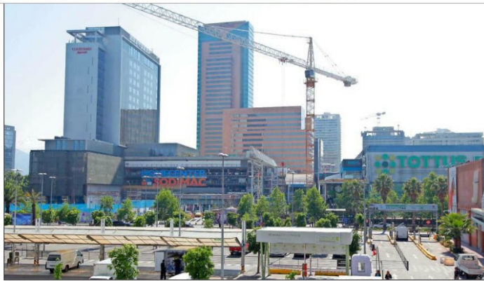
Un hotel Hilton cinco estrellas (el primero en su tipo en Chile) es parte de la nueva fase de expansión de Parque Arauco. La inversión será de US$ 200 millones.

LA NUEVA FALABELLA — CUYA CONSTRUCCIÓN PARTIRÍA EL PRIMER SEMESTRE DE 2017, PARA ABRIR A PÚBLICO EN 2021—, TENDRÁ CUATRO PISOS QUE ESTARÁN CONECTADOS CON EL CENTRO COMERCIAL, EL DISTRITO DE LUJO Y EL BULEVAR.